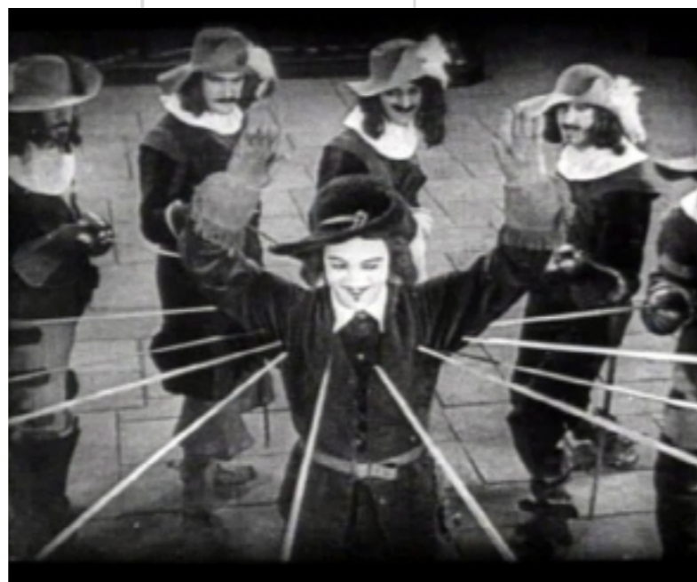
L'Étroit Mousquetaire, 1922

La Fondation Jérôme Seydoux-Pathé consacre les vacances d'hiver à Max Linder et invite petits et grands à la (re)découverte d'une œuvre passionnante et rend hommage à un pionnier du cinéma dont l'élégance et l'inventivité a influencé le genre comique au-delà des frontières françaises.